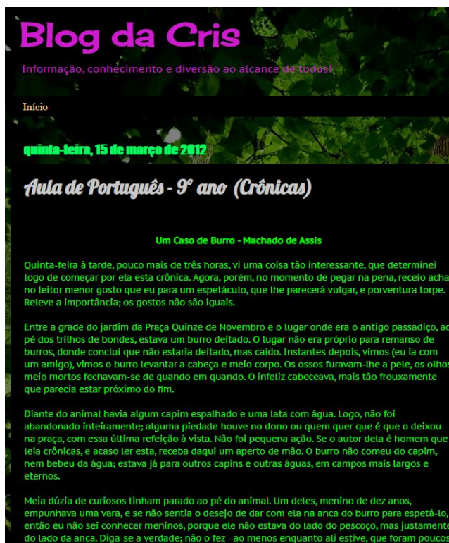
Figura 1 - Blog da Cris

utilizar mídias que auxiliam o estudo e que não são disponibilizadas quando se está numa típica sala de aula brasileira.