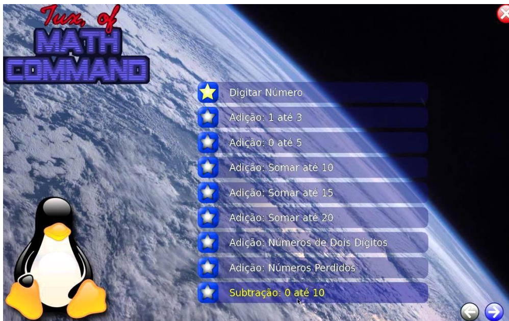
Figura 01 tela inicial do jogo tux.

Semelhante a um jogo chamado Missile Command que fez muito sucesso no videogame Atari nos anos 80 , o Tux Math não apresenta mísseis caindo sobre a cidade, mas asteroides. A primeira versão, lançada em setembro de 2011, que mostrava imagens de cidades, foi modificada e o plano de fundo do jogo ganhou imagens do espaço sideral.