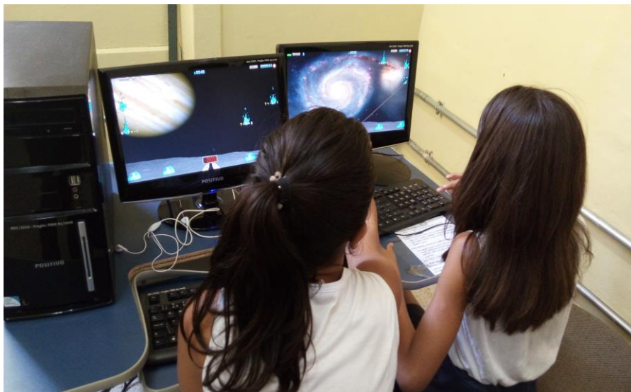
Figura 05 Aluna ajudando a colega em uma determinada fase do jogo.

No terceiro dia do jogo, ou seja, no dia quatro de Novembro, o mesmo procedimento foram executados, nesse dia o formando pediu para que todos jogassem a fase de Comando e treinamento matemático acadêmico, um estilo de jogo livre na qual os alunos escolhiam o nível que queria jogar. Cada nível que fosse cumprido o mesmo ganhava uma estrelinha. Mais uma vês eles começaram a competir para ver quem ganhava mais estrelinhas. O bom desse estilo de jogo, que o aluno pode escolher um determinado nível mais fácil contas vezes quiser, porém ele só ganhará uma estrelinha até que o jogo seja reiniciado. Assim o aluno que quiser ganhar mais estrelinhas terá de jogar níveis mais difíceis. Logo depois que todos os alunos jogaram no terceiro dia na sala de aula o formando com ajuda da professora passou o mesmo formulário de pesquisa para os alunos, porém com uma pergunta a mais na qual vinha perguntando. O que você mais gostou no jogo? Uma grande parte dos alunos responderam respostas idênticas, “ Gostei de tudo”, Outras respostas dos alunos “ O ensinamento que ele trás”, “ O aprendizado de forma divertida”, “ O jeito de pensar rápido para responder”, “ Gostei da musica e do barulho dos tiros de canhão”, “ Gostei do jeito de resolver as contas”etc.