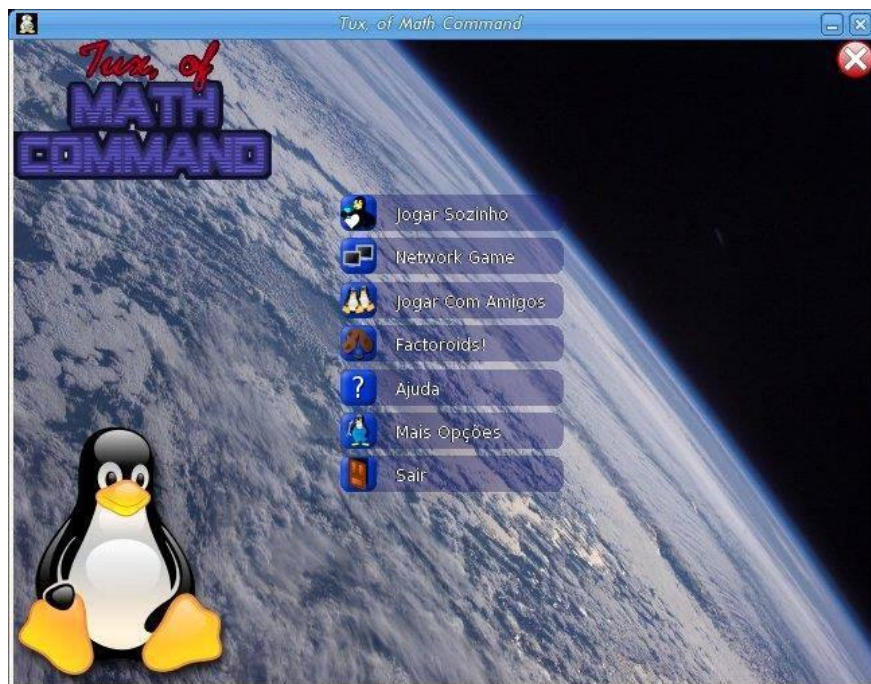
Figura 02 opções de comando do jogo tux.

Pode ser utilizado no ambiente escolar por educadores como um material complementar, auxiliando-os tanto nos processos iniciais de compreensão das operações algébricas, quanto no desenvolvimento sensitivo das crianças. (IFRGS, 2015).