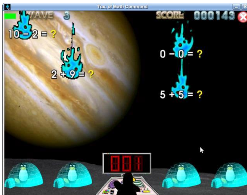
Figura 03 Fase adição e subtração de números até 15.

Muito interessante no jogo é a trilha sonora, com uma música estilo Rock Clássico estimula o aluno a sempre querer jogar mais. Cada fase que o aluno passa muda a música.